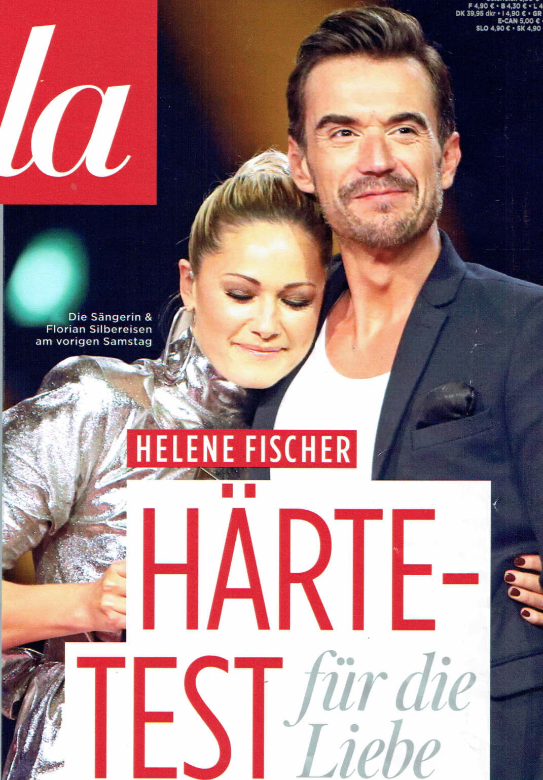
Die Sängerin & Florian Silbereisen am vorigen Samstag